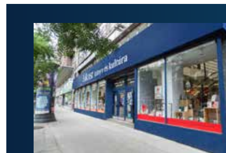
Budapest Fókusz Könyváruház

A Lira Könyv Zrt. nemcsak kereskedelmi, hanem kulturális szempontból is jelentős szereplője a magyar könyvpiacnak: a Lira csoporthoz tartozik kilenc könyvkiadó, két, kulturális eseményeknek otthont adó rendezvényhelyszín, egy privát művészügynökség, egy print és online formában is megjelenő programmagazin és két saját gyártású magazin.