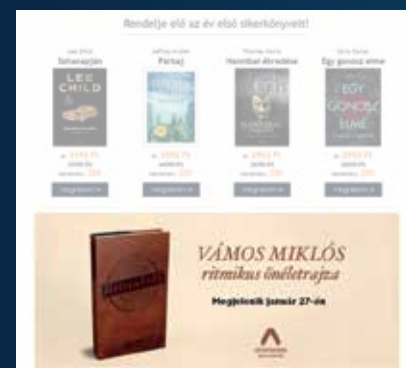
Hírlevél banner kiemelés