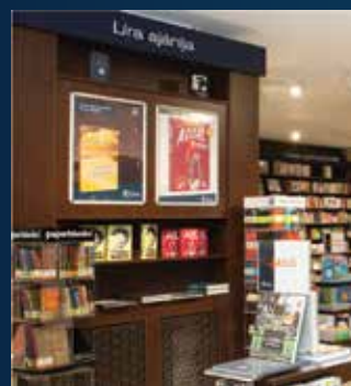
Plakátkihelyezés bolton belül

Bolthálózatban történő kiemelés a berendelt mennyiségtől függően kérhető! A példányszámokat a marketinggel történő megállapodás előtt a beszerzéssel kell egyeztetni.