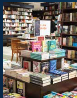
Kiemelés ajánlati piramison