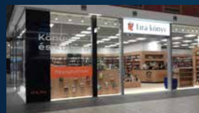
Savoya Park Lira Könyvesbolt