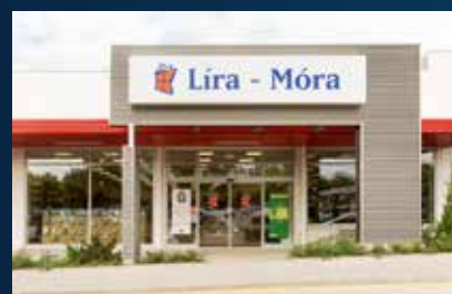
Veszprém Tesco Strip Mall Lira-Móra Könyváruház