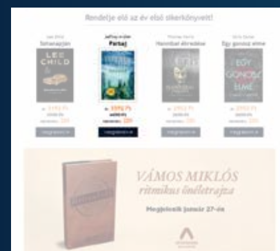
Hírlevél 1/4 megjelenés